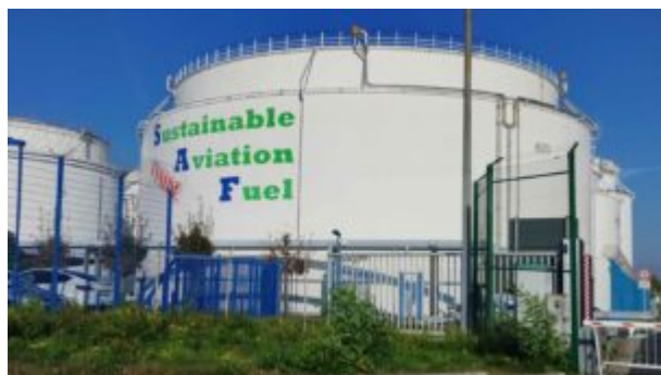
Großtank im Treibstoffpark des Flughafen Frankfurts.

Als Fazit ergibt sich, dass Anspruch und Wirklichkeit bei der Thematik „Nachhaltiger Luftverkehr“